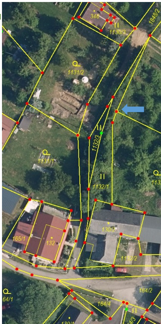
Obr. 3 – Mapa KN a ortofoto

Zásadní vadou je, že dokumentace ZPMZ č. xxx v k.ú. xxxxxx neprokazuje, že daná změna byla zpracována na základě ztotožnění polohopisu katastrální mapy se skutečnou situací v terénu prostřednictvím identických bodů. Poloha bodů napojení změny (body č. 1 a 3) a navazujících kontrolních bodů byla v terénu vyznačena podle zobrazení hranic v katastrální mapě (vytyčeny souřadnice obrazu) a dokumentace ZPMZ neosvědčuje, že takto určená poloha bodů je ve vztahu k okolním nemovitostem správná a že daná změna tak byla správně navázána na polohopisný obsah katastrální mapy. Dokumentace neobsahuje zaměření dostatečného množství identických bodů a dalších bodů situace, ani výpočty spojené s přiřazením změny a dalších výpočtů posuzujících výsledky zaměření s údaji katastru nemovitostí v protokolu